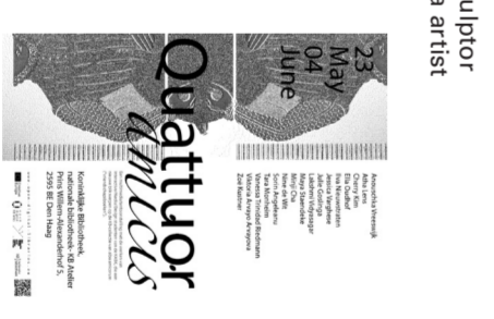
Other credits Medina Rasic, video Noë Baccant, photography Dimitrius van der Vliet, Wang Sophie Reijnders, Docent vroegmoderne Nederlandse terkrunder en geschiedenis